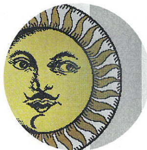
Teller von Fornasetti an der Wand? Warum nicht gleich ein Glasmosaik? In Kollaboration mit Bisazza erscheinen nun die vier ikonischen Motive „Soli a Capri“ (o.), „Ortensia“, „Bocca“ und „Serratura“ in Puzzleform, 10 x 10 mm, 1659 Euro/m². bisazza.com