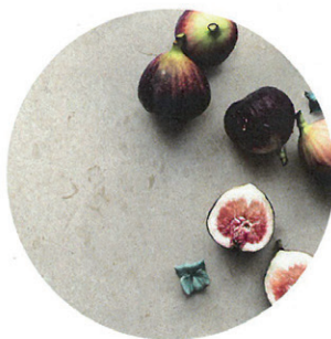
Beinahe so weich wie reife Feigen ist die Haptik der „Carácter“-Bodenfliesen aus Feinsteinzeug von Marazzi, hier im Ton „Blanco“. Und, sehr passend: Sie lassen sich drinnen wie draußen einsetzen, ab 30 x 30 cm, Preis auf Anfrage. marazzi.de