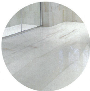
Steinbrüche mit Onyxvorkommen sind heute geschützt. Die Maserung und Gespinnste bildet La Fabbrica daher einfach mit „Aesthetica Wilde“ nach, Fliesen aus 6 mm starker Keramik, hier mit Lappato-Finish, ab 80 x 80 cm, Preis auf Anfrage. lafabbrica.it