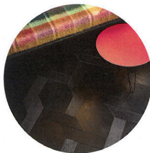
Eine heiße Sohle aufs eigene Parkett legen? Lässt sich besonders stilecht auf der Maßanfertigung „Chaussures“ aus Vogesen-Eiche von Parkett Dietrich, 250 Euro/m². Für zusätzlichen Glamour beim Auftritt sorgt das Black-Finish. parkett-dietrich.de